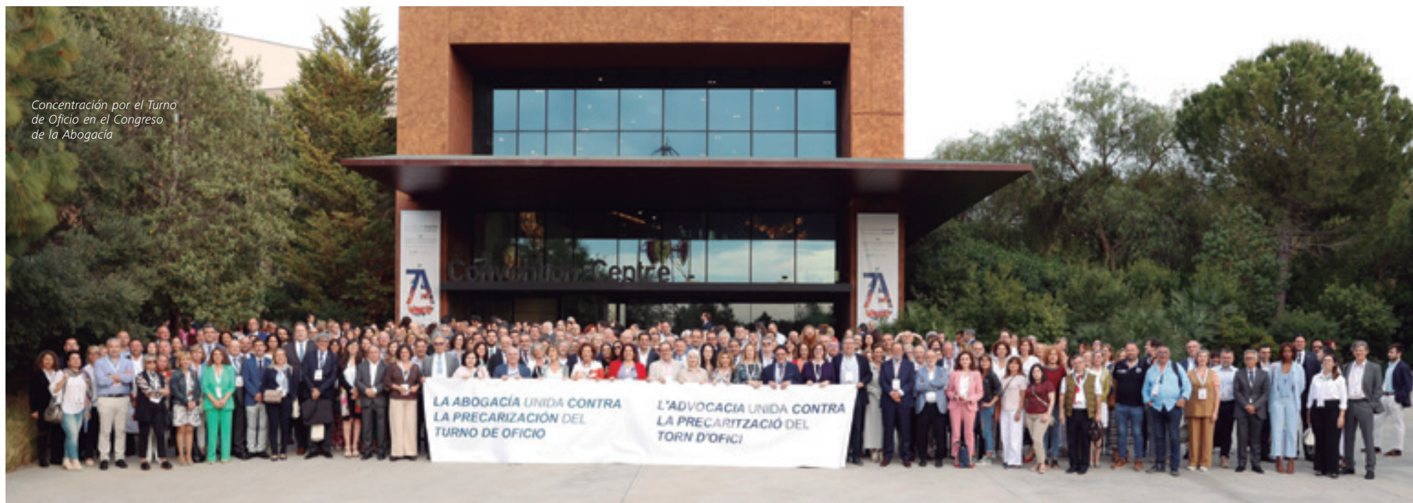
Concentración por el Turno de Oficio en el Congreso de la Abogacía

A lo largo de todo el año el Consejo General de la Abogacía Española instó a las administraciones públicas con competencias en materia de justicia, al resto de instituciones y a los partidos políticos a trabajar para alcanzar un Pacto que responda a las necesidades del servicio público de Justicia Gratuita y el Turno de Oficio, y de los profesionales que prestan este servicio.