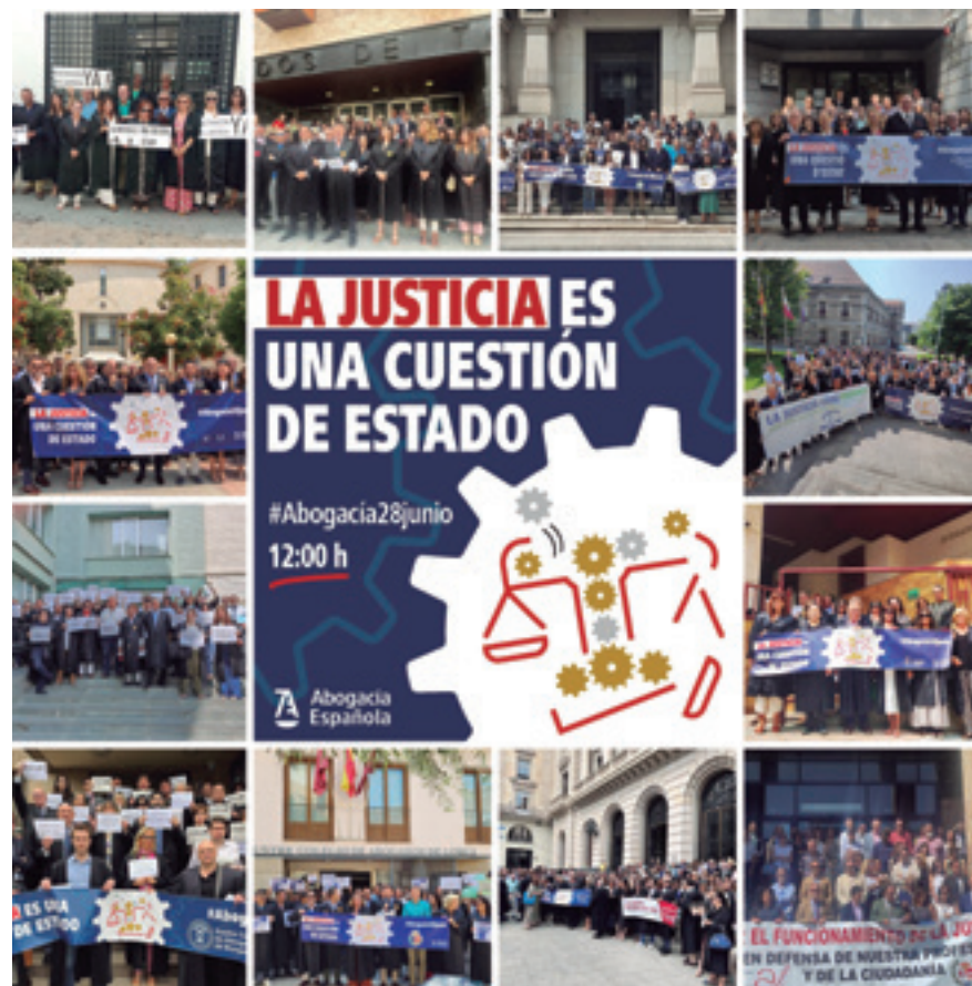
Concentraciones de abogados y abogadas en las principales sedes judiciales del país

La situación alcanzó tal grado de deterioro que el 28 de junio, miles de abogados y abogadas de toda España, convocados por el Consejo General de la Abogacía Española, se manifestaron a las puertas de las principales sedes judiciales para mostrar su enorme preocupación por todo el tiempo de paralización de juzgados y tribunales que habían colapsado el servicio público de justicia del país.