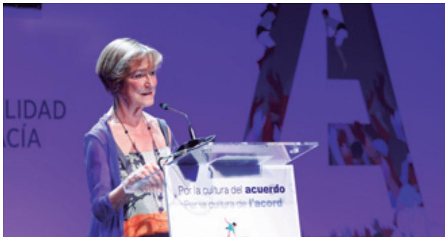
La presidenta de la Abogacía, Victoria Ortega, en la inauguración del XIII Congreso de la Abogacía