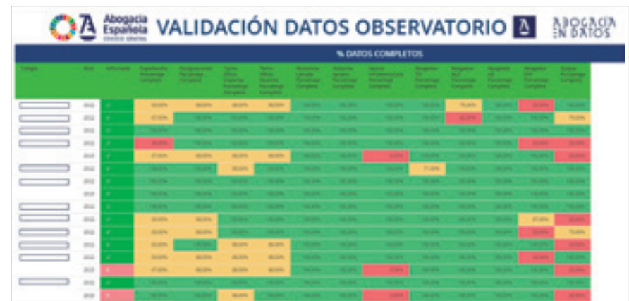
Panel de control para el Consejo