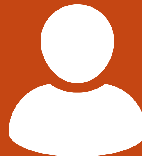
Por designar Secretaría