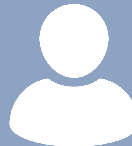
Por designar Secretaría